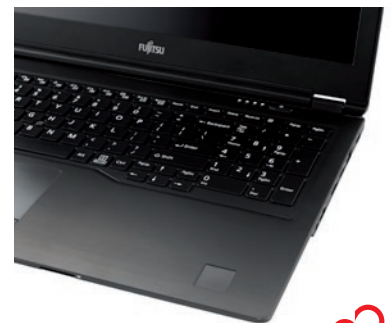
Lifebook U757 mit Venenscanner

jetzt in unserer Ausstellung vorführbereit!